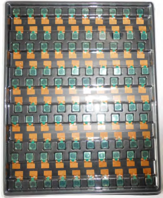
Abdeckschale mit Deckel