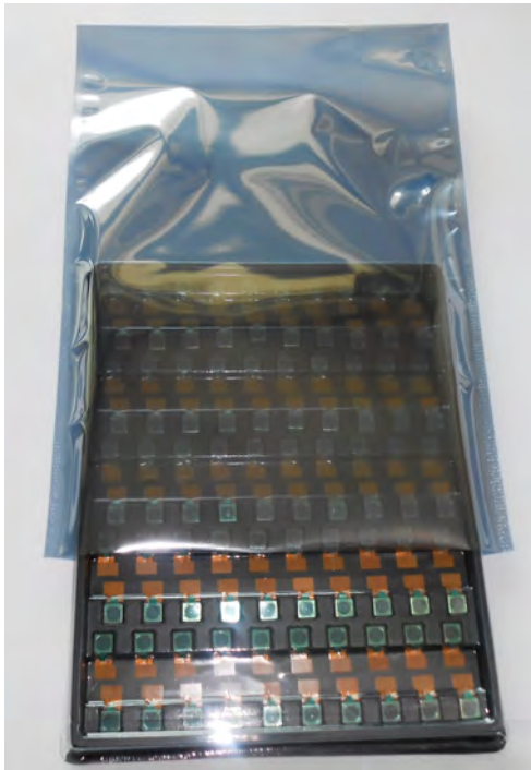
In Antistatikbeutel stecken