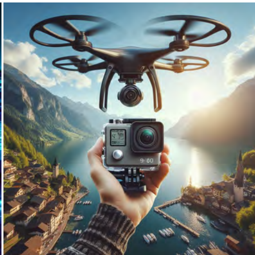
Drohnen- und Sport-Adleraugen